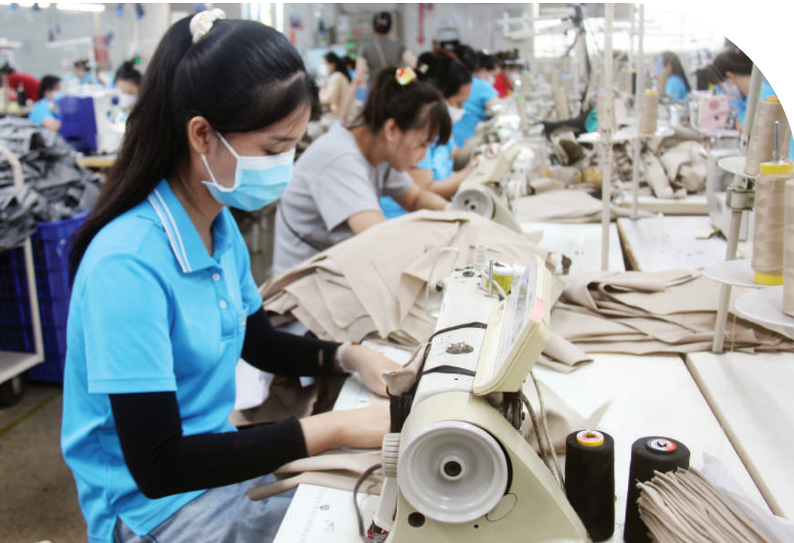
Hoạt động sản xuất tại một doanh nghiệp dệt may ở Cụm công nghiệp Phú Cường (xã Thống Nhất, tỉnh Đồng Nai) - Việc bình ổn giá xăng dầu góp phần giảm bớt áp lực chi phí đầu vào, giúp doanh nghiệp ổn định sản xuất trong năm 2026.

Sở Công Thương Đồng Nai cam kết thực hiện quyết liệt vai trò giám sát, phối hợp chặt chẽ với các cơ quan Trung ương để chính sách bình ổn giá lan tỏa thực chất đến mọi hoạt động kinh tế - xã hội, giữ vững vị thế là động lực tăng trưởng quan trọng của cả nước. ■