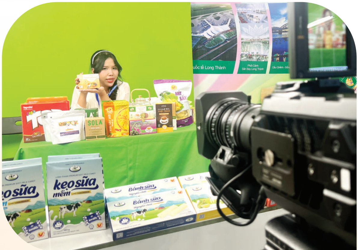
Phiên live stream bán hàng, quảng bá sản phẩm địa phương tại gian hàng của Đồng Nai tại hội chợ hàng Việt Nam tiêu biểu xuất khẩu năm 2025.

Với nền tảng xuất siêu vững chắc trong Quý I, cùng sự chủ động trong việc nhận diện và tháo gỡ các rào cản thực tiễn, ngành Công Thương Đồng Nai tự tin sẽ hoàn thành các chỉ tiêu kinh tế - xã hội giai đoạn 2026-2030, khẳng định vị thế đầu tàu kinh tế của tỉnh và cả nước. ■