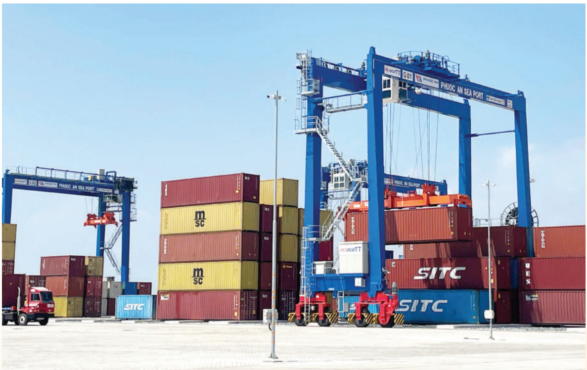
Hoạt động bốc dỡ hàng hóa tại cảng Phước An.

Trên nền tảng hội nhập sâu rộng, ngành Công Thương tỉnh Đồng Nai khẳng định cam kết tiếp tục đồng hành, giúp cộng đồng doanh nghiệp tận dụng tối đa “đòn bẩy” từ các FTA để bứt phá mạnh mẽ trong năm bản lề 2026. ■