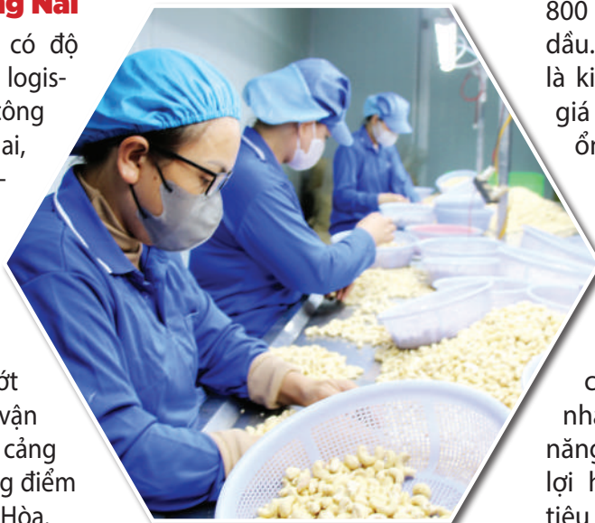
Sản xuất sản phẩm hạt điều tại một doanh nghiệp ở xã Xuân Hòa.

Chính sách đặc biệt này có hiệu lực ngắn hạn đến