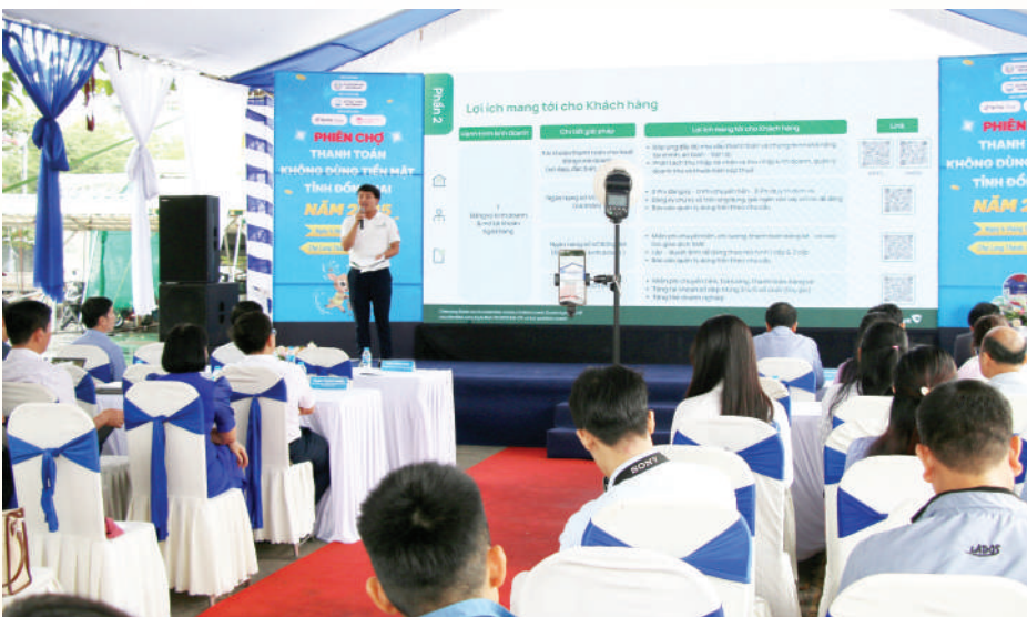
Các doanh nghiệp địa phương tham gia phiên chợ thanh toán không dùng tiền mặt tỉnh Đồng Nai và live stream quảng bá, bán hàng trực tuyến năm 2025 do Sở Công Thương tổ chức.

Sự kết hợp giữa kết quả thực tiễn “Top 10 cả nước trong 9 năm liên tiếp” của Đồng Nai và khung pháp lý mới từ Bộ Công Thương đang tạo ra một lực đẩy cộng hưởng. TMĐT không còn chỉ là kênh bán hàng mà đã trở thành hệ sinh thái tích hợp giữa công nghệ, thanh toán không tiền mặt và logistics xanh. Đối với một “thủ phủ công nghiệp” như Đồng Nai, đây là cơ hội vàng để bứt phá và nâng cao giá trị chuỗi cung ứng trong kỷ nguyên số. ■