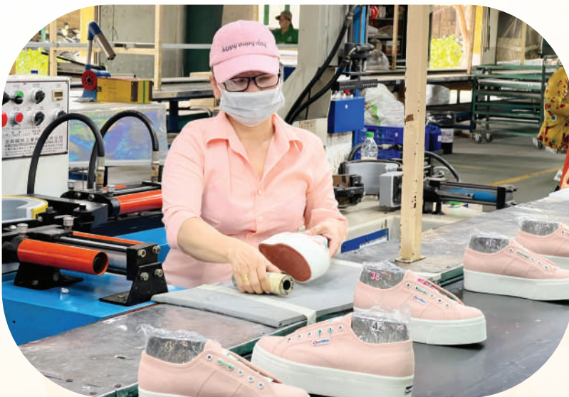
Sản xuất giày tại một doanh nghiệp ở xã Nhơn Trạch.

Với phương châm điều hành “6 rõ”, ngành Công Thương cam kết đồng hành sát sao cùng doanh nghiệp, biến PVTM từ thách thức thành cơ hội để khẳng định bản lĩnh của hàng Việt trong dòng chảy hội nhập. ■