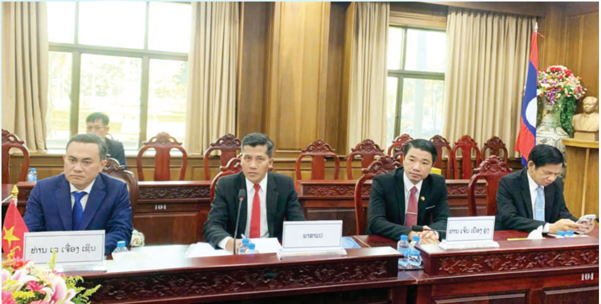
Đại diện Lãnh đạo tỉnh và Sở Công Thương tỉnh Đồng Nai tham gia thảo luận các giải pháp hợp tác, hỗ trợ doanh nghiệp địa phương tận dụng các ưu đãi thuế quan trong khối ASEAN để mở rộng thị trường xuất khẩu năm 2026 tại tỉnh Champasak (Lào).