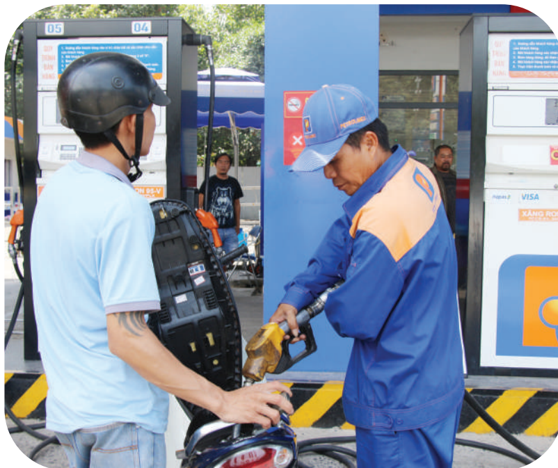
Người dân đến đổ xăng tại một cửa hàng bán lẻ xăng dầu tại xã An Viễn, tỉnh Đồng Nai.

Có hiệu lực thi hành ngay từ ngày ký (27/03/2026), Nghị quyết giao Bộ Công Thương đóng vai trò “nhạc