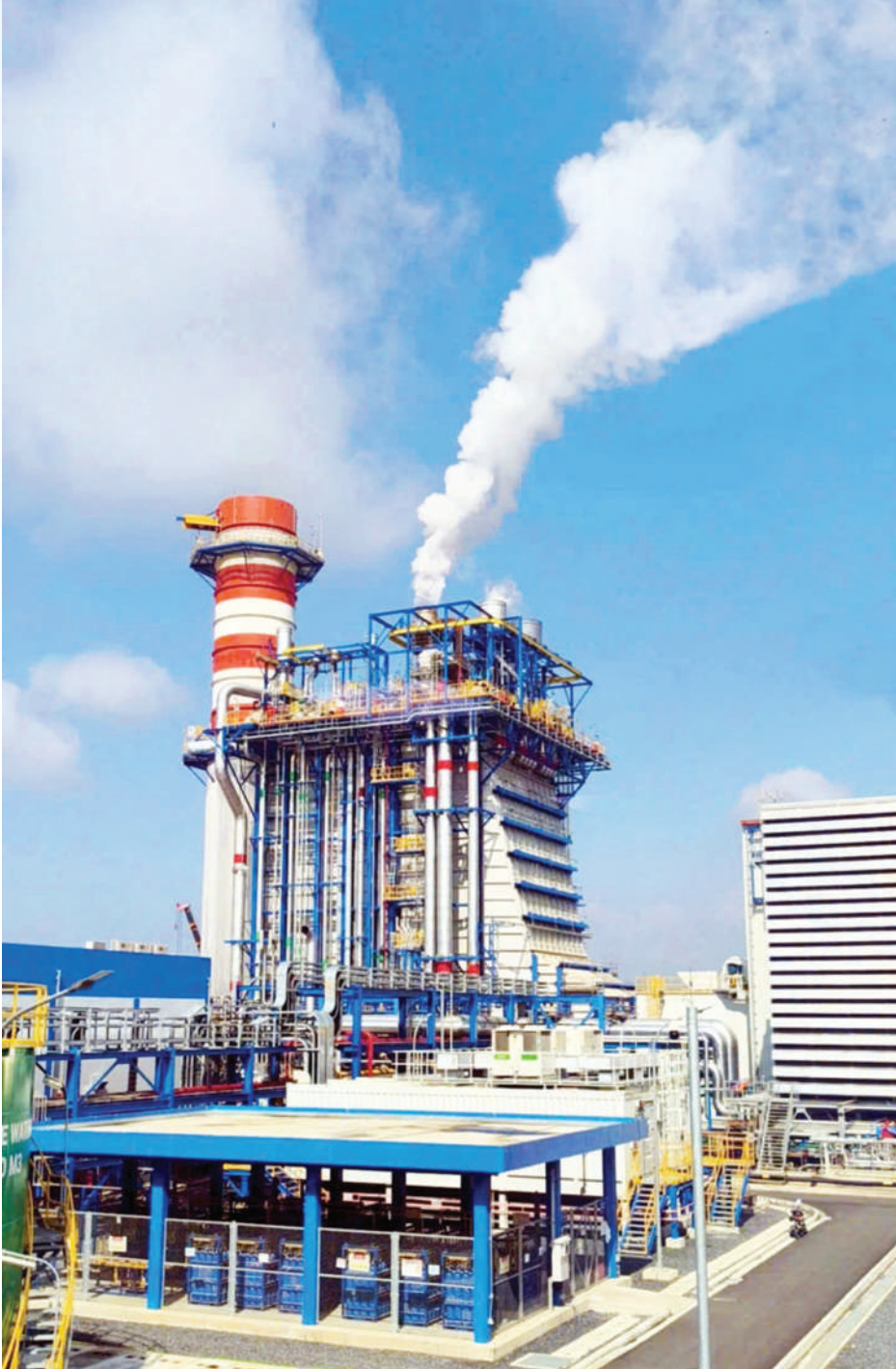
Dự án nhà máy Nhiệt điện tại Nhơn Trạch 3, 4 - nguồn cung quan trọng trong hệ thống năng lượng của tỉnh Đồng Nai.

đáp từ 60% - 70% nhu cầu tiêu thụ trong nước, giảm sự phụ thuộc vào nguồn cung ngoại khối.