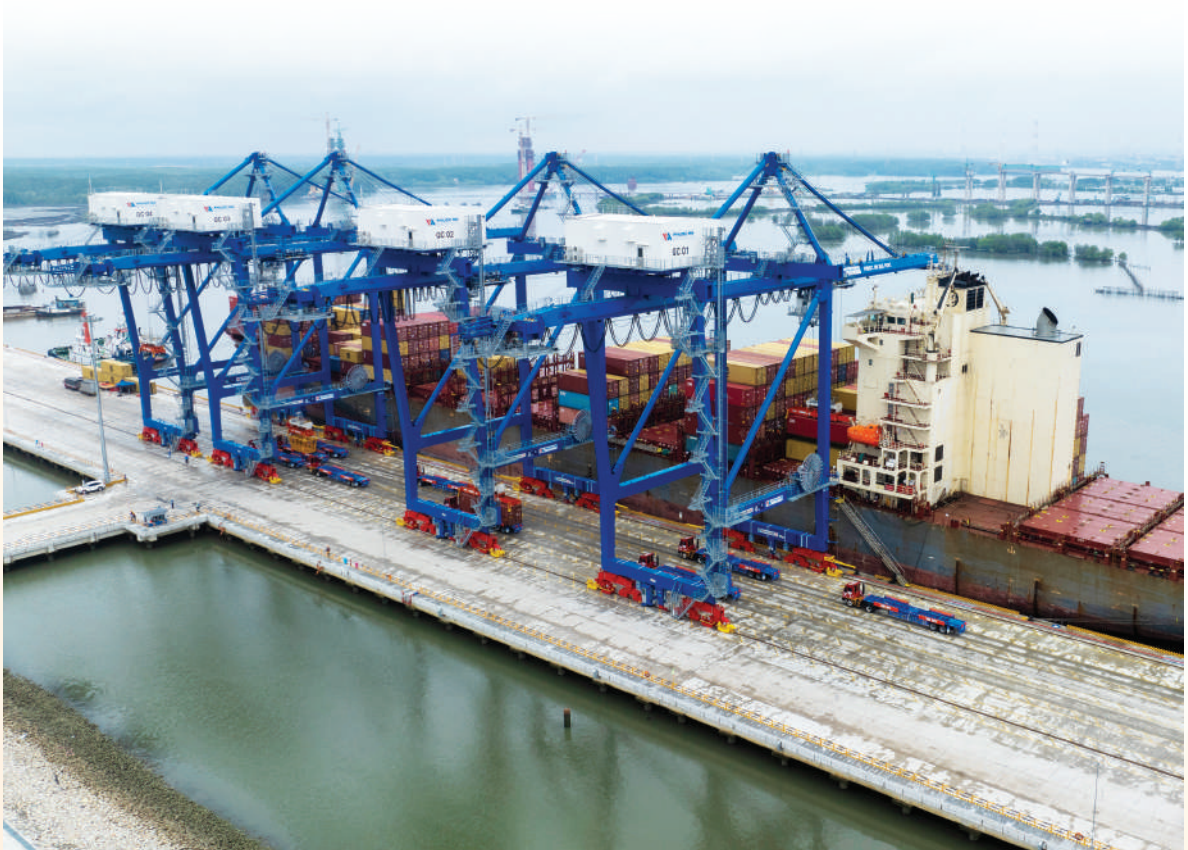
Hoạt động dịch vụ cảng tại cảng Phước An (xã Phước An, tỉnh Đồng Nai).

Tại phân khúc cụm công nghiệp (CCN), toàn tỉnh có 63 CCN được quy hoạch (3.701,96 ha). Đáng chú ý, 12 CCN đã đi vào hoạt động với sự góp mặt của 11 chủ đầu tư hạ tầng uy tín tại các khu vực trọng điểm như Tân Tiến, Tân Phú, Tiến Hưng, Thanh Phú - Thiện Tân... Tỷ lệ lấp đầy tại các cụm này đang ở mức rất cao, đáp ứng mặt bằng sản xuất cho 239 dự án đăng ký đầu tư.