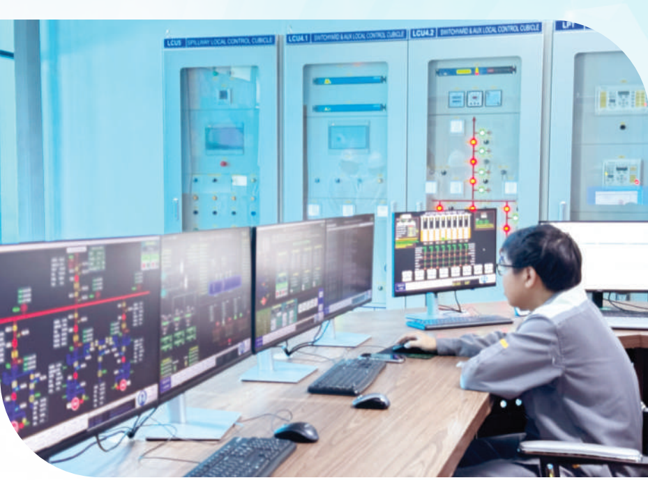
Hệ thống vận hành hoạt động tại Nhà máy Thủy điện Phú Tân 2 (xã Phú Vinh, tỉnh Đồng Nai).

3/2026 (tăng mạnh 30-40%). Trước áp lực “gọng kìm” từ chi phí vận tải và rủi ro đứt gãy chuỗi cung ứng, vai trò điều phối vĩ mô của Bộ Công Thương đã trở thành lá chắn quan trọng. Với tổng nguồn cung cả nước đạt 8,173 triệu m 3 /tấn, chúng ta đã tạo ra một vùng đệm an toàn so với mức tiêu thụ thực tế 7,05 triệu m 3 /tấn, giữ vững mức tồn kho chiến lược khoảng 1,5-1,6 triệu m 3 /tấn.