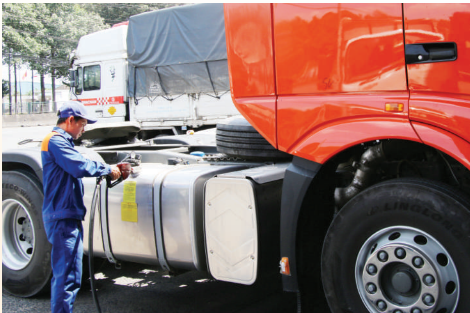
Hoạt động kinh doanh xăng dầu tại một cửa hàng bán lẻ xăng dầu ở xã An Viễn.

- Gia tăng nội lực cung ứng: Thực hiện Chỉ thị 06/CT-BCT, năng lực sản xuất nội địa được đẩy lên mức tối đa. Các cơ sở Ethanol, Condensat được đưa vào vận hành khẩn cấp để bù