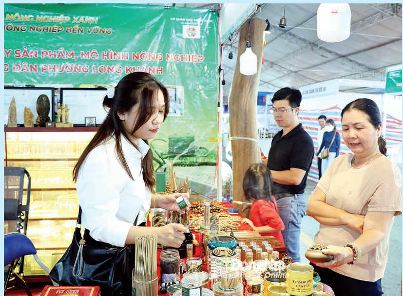
Sản phẩm công nghiệp nông thôn tham gia Hội chợ Triển lãm sản phẩm công nghiệp nông thôn tiêu biểu vùng Đông Nam Bộ - Đồng Nai năm 2025.

Mở rộng thị trường tiêu thụ chính là chìa khóa mở ra cánh cửa phát triển bền vững cho các cơ sở CNNT, các cơ sở sau