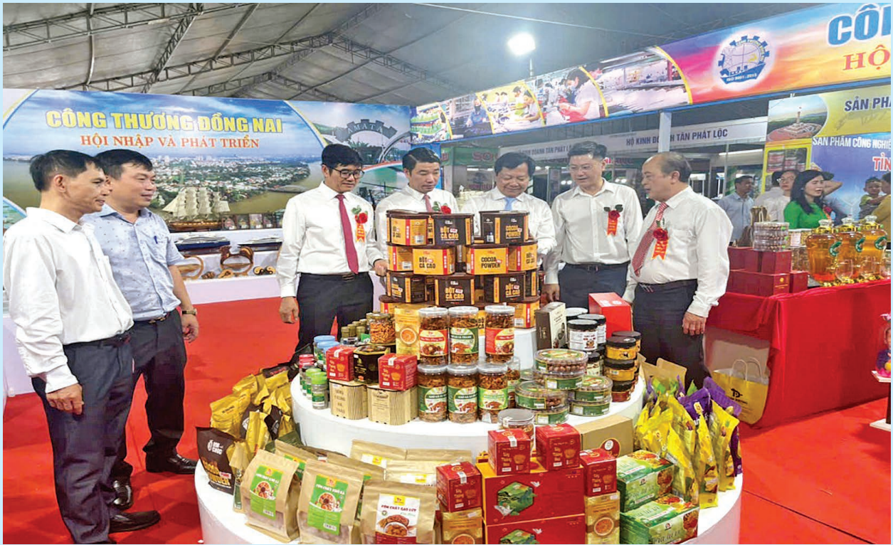
Hội chợ triển lãm sản phẩm công nghiệp nông thôn tiêu biểu vùng Đông Nam Bộ - Đồng Nai 2025 được tổ chức tại Đồng Nai.

xanh, sạch, thân thiện môi trường và sản phẩm chế biến sâu. Đây là cơ hội để các ngành nghề thế mạnh của Đồng Nai như chế biến nông sản, thực phẩm, gỗ mỹ nghệ, cơ khí, thủ công mỹ nghệ... nâng cao giá trị thương hiệu và mở rộng thị trường sự phát triển mạnh mẽ của thương mại điện tử và chuyển đổi số cũng tạo điều kiện để các cơ sở công nghiệp nông thôn tiếp cận khách hàng nhanh hơn, giảm phụ thuộc vào phương thức kinh doanh truyền thống. Nếu tận dụng tốt xu hướng này, khuyến công sẽ trở thành cầu nối hiệu quả giữa sản xuất và thị trường tiêu dùng hiện đại.