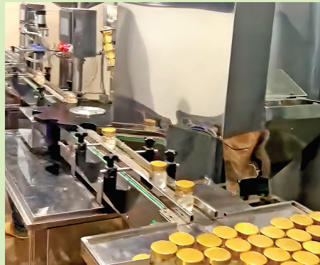
Dây chuyền sản xuất công nghệ chiết suất nước yến của Hộ kinh doanh Yến sạch Dương Vũ.

Những mô hình đổi mới sáng tạo này đều gắn chặt với hoạt động khuyến công của Đồng Nai. Thông qua hỗ trợ máy móc, đào tạo nhân lực, xúc tiến thương mại và xây dựng thương hiệu, chương trình khuyến công đã trở thành bộ đỡ quan trọng giúp các cơ sở chế biến thực phẩm mạnh dạn đổi mới công nghệ, nâng cao chất lượng sản phẩm và mở rộng thị trường.