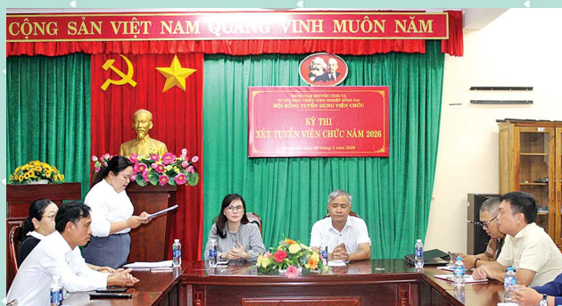
Thi xét tuyển viên chức 2026 Trung tâm Khuyến công & TVPTCN.