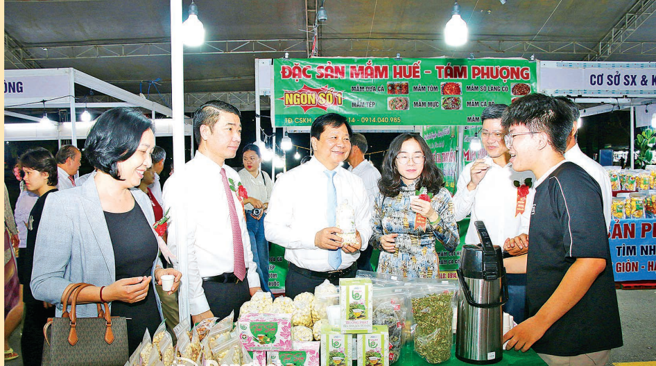
Lãnh đạo tỉnh Đồng Nai và lãnh đạo các sở, ngành tham quan gian hàng các sản phẩm của Đồng Nai tại Hội chợ Triển lãm hàng công nghiệp nông thôn tiêu biểu vùng Đông Nam Bộ - Đồng Nai năm 2025.

Đối tượng tham gia: Các cơ sở công nghiệp nông thôn trên địa bàn thành phố Đồng Nai, bao gồm: doanh nghiệp nhỏ và vừa, hợp tác xã, liên hiệp hợp tác xã, tổ hợp tác, hộ kinh doanh trực tiếp đầu tư, sản xuất công nghiệp - tiểu thủ công nghiệp tại các xã (sau đây gọi chung là cơ sở công nghiệp nông thôn); Các cơ quan, tổ chức, cá nhân có liên quan đến công tác quản lý, tổ chức thực hiện hoạt động khuyến công và tham gia phối hợp trong quá trình tổ chức bình chọn sản phẩm công nghiệp nông thôn tiêu biểu.