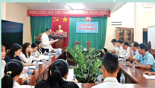
Hội nghị viên chức, người lao động năm 2026.