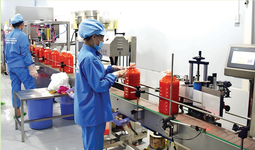
Cơ sở nước chấm Hoa Sen đầu tư dây chuyền triết rót sản phẩm tương ớt.

nông thôn, giúp sản phẩm Đồng Nai vươn ra thị trường toàn cầu.