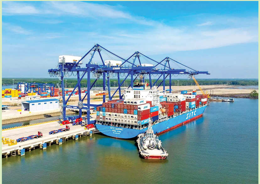
Cảng Phước An là một trong những cảng trọng điểm của khu vực phía Nam, đóng vai trò trung tâm logistics kết nối Đồng Nai và vùng TP.HCM

đầu tư hạ tầng chiến lược phục vụ công nghiệp, thương mại và logistics, nhất là hạ tầng kết nối Cảng hàng không quốc tế Long Thành, cảng Phước An, khu kinh tế cửa khẩu Hoa Lư, các khu công nghiệp, cụm công nghiệp, trung tâm logistics, tuyến giao thông liên vùng và hạ tầng số.