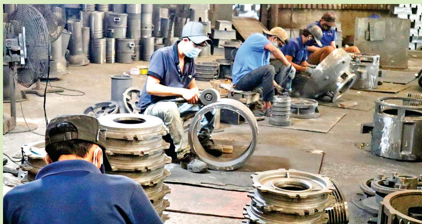
Sản xuất ở Công ty TNHH Tam Hiệp Thành.

Hoạt động trên 35 năm, Công ty TNHH Tam Hiệp Thành đóng trên địa bàn phường Trảng Dài, thành phố Đồng Nai với ngành nghề chính là đúc các sản phẩm phục vụ ngành nước từ gang, thép đang giải quyết việc làm cho hơn 100 lao động với mức thu nhập từ 7 đến 20 triệu đồng/người/tháng tùy vào tay nghề và thâm niên, với môi trường lao động này tiềm ẩn nguy cơ tai nạn lao động rất cao. Vì vậy, doanh nghiệp đã quan tâm đầu tư không gian làm việc an toàn. Người lao động đã có ý thức thực hiện