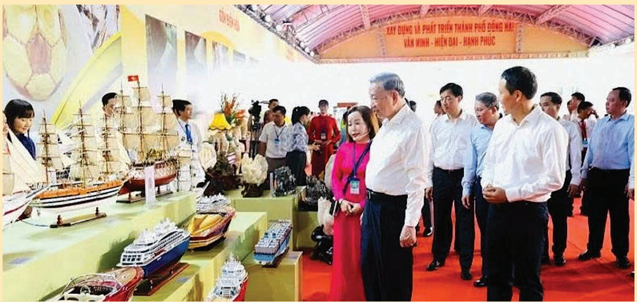
Tổng Bí thư, Chủ tịch nước Tô Lâm cùng các đồng chí lãnh đạo Đảng, Nhà nước thăm gian trưng bày các sản phẩm công nghiệp nông thôn tiêu biểu của thành phố Đồng Nai.

Trong bối cảnh đó, CNNT phải cạnh tranh trực tiếp với các khu công nghiệp, cụm công nghiệp công nghệ cao – nơi có lợi thế vượt trội về vốn, công nghệ, quản trị và chuỗi cung ứng. Sự chênh lệch này khiến nhiều cơ sở CNNT khó tham gia sâu vào chuỗi giá trị sản xuất, đặc biệt là chuỗi cung ứng toàn cầu đang hình thành nhanh chóng tại địa phương.