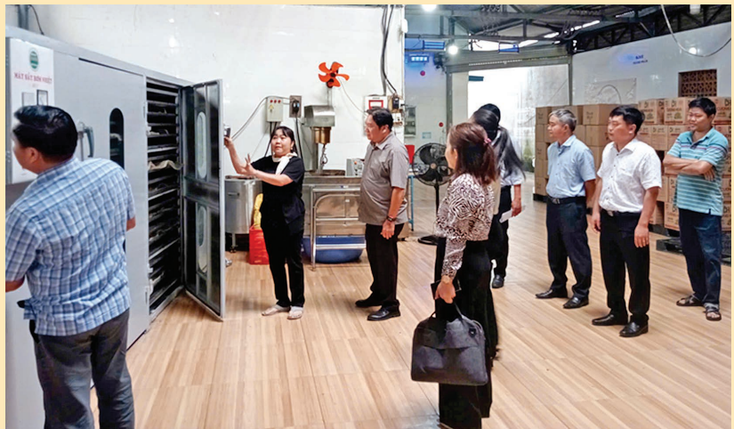
Đoàn liên ngành thẩm định đề án Hỗ trợ máy móc thiết bị tiên tiến.

Với những thành tựu như ngày nay, không thiếu sự đóng góp của các doanh nghiệp tại Đồng Nai trong đó có các doanh nghiệp vừa và nhỏ và sở dĩ các doanh nghiệp vừa và nhỏ có thể đóng góp được một phần công sức của mình cho sự phát triển của tỉnh nhà cũng nhờ vào sự hỗ trợ hết mình của nhà nước qua những chính sách, chủ trương, đường lối lãnh đạo đúng đắn tạo điều kiện để doanh nghiệp trên địa bàn tỉnh có thể tự do phát huy hết nội lực của doanh nghiệp mình vì đằng sau luôn có sự hỗ trợ, tạo động lực để doanh