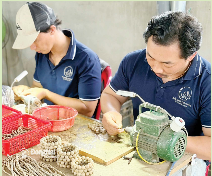
Sản xuất ở một cơ sở công nghiệp nông thôn tại phường Long Khánh, TP.Đồng Nai.

dữ liệu về công nghiệp nông thôn; cơ sở dữ liệu về kết quả hoạt động khuyến công tỉnh Đồng Nai. Hỗ trợ in ấn, phát hành catalog sản phẩm công nghiệp nông thôn tiêu biểu của tỉnh.