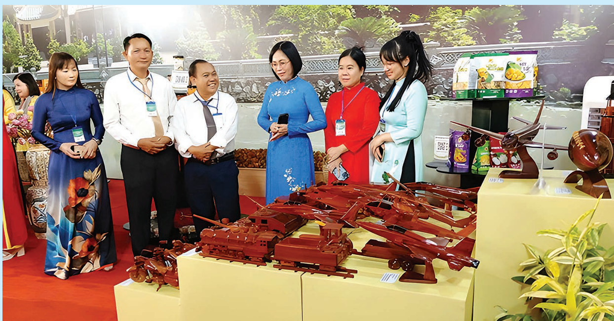
Bà Nguyễn Thị Hoàng - Phó chủ tịch thành phố giao lưu với doanh nghiệp gỗ mỹ nghệ tại khu trưng bày gian hàng triển lãm, giới thiệu sản phẩm thủ công mỹ nghệ tiêu biểu, phục vụ lễ công bố Nghị quyết của Quốc hội về việc thành lập thành phố Đồng Nai.

thôn; Tổ chức 3 lần bình chọn sản phẩm công nghiệp nông thôn tiêu biểu cấp tỉnh và hỗ trợ tham gia 2 lần bình chọn sản phẩm công nghiệp nông thôn tiêu biểu cấp quốc gia; Tham gia 15 hội chợ, triển lãm sản phẩm công nghiệp nông thôn tiêu biểu trong và ngoài tỉnh; Hỗ trợ đầu tư 10 phòng trưng bày giới thiệu sản phẩm công nghiệp nông thôn tiêu biểu cho các cơ sở CNNT; Tổ chức 09 hội thảo chuyên đề về nâng cao năng lực quản lý, tiết kiệm chi phí trong sản xuất, ứng dụng chuyển đổi số cho các cơ sở công nghiệp nông thôn trong tình hình mới; Xuất bản 10 Bản tin Khuyến công điện tử; Xây dựng và phát sóng 60 chuyên đề khuyến công phát sóng trên sóng truyền hình Đồng Nai; Tổ chức 15 hội thảo phổ biến