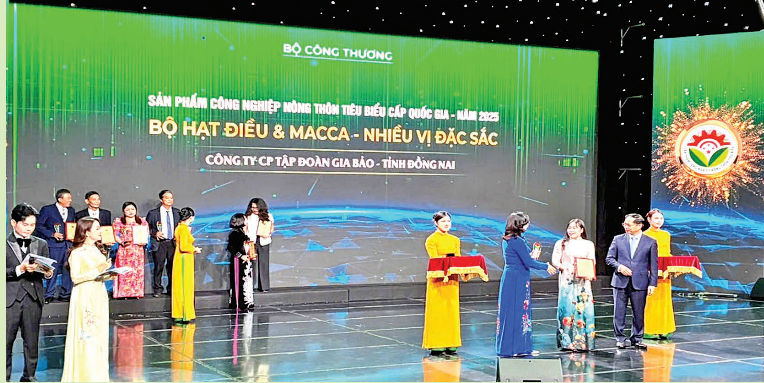
Công ty CP Tập đoàn Gia Bảo được Bộ Công Thương vinh danh Sản phẩm công nghiệp nông thôn tiêu biểu cấp quốc gia tại Hà Nội.