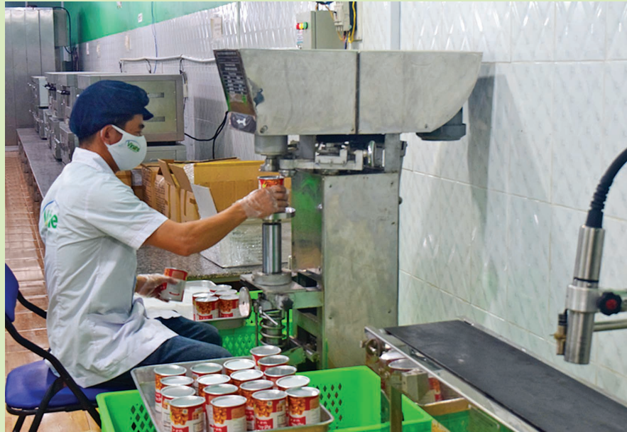
Đổi mới công nghệ của Công ty TNHH Vinahe - Phước Bình Đồng Nai.

Một trong những điển hình là Cơ sở Nước Chấm Hoa Sen ở Long Khánh, với hơn ba thập kỷ phát triển, đã kết hợp nguyên liệu dân gian với dây chuyền sản xuất hiện đại để tạo ra các sản phẩm