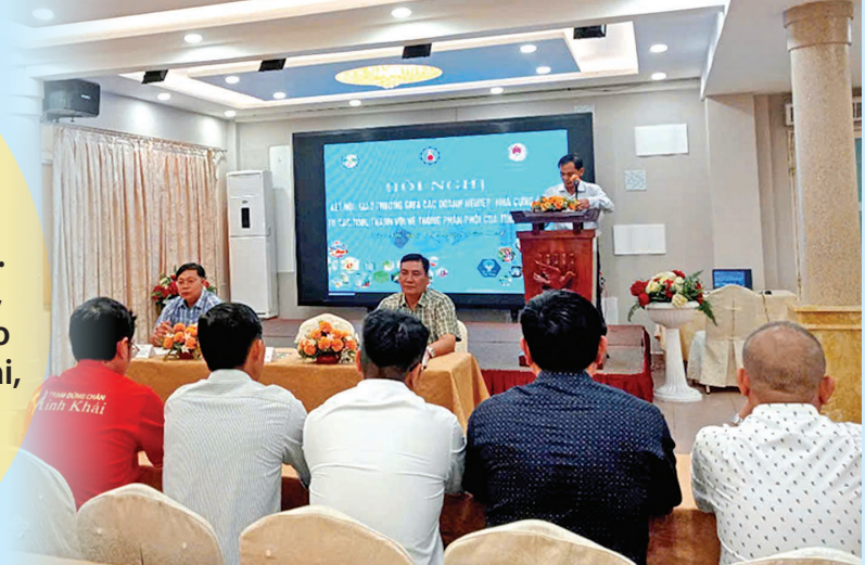
Hội nghị kết nối giao thương giữa doanh nghiệp, nhà cung cấp, nhà phân phối với các siêu thị giữa Đồng Nai, Cần Thơ, Trà Vinh.

Hoạt động khuyến công tại Đồng Nai đã và đang trở thành động lực quan trọng thúc đẩy công nghiệp nông thôn phát triển khi Đồng Nai lên thành phố trực thuộc Trung ương. Thông qua hỗ trợ đổi mới công nghệ, phát triển sản phẩm tiêu biểu, đào tạo nguồn nhân lực và xúc tiến thương mại, khuyến công đã giúp các cơ sở CNNT nâng cao năng lực cạnh tranh, đóng góp tích cực vào phát triển kinh tế - xã hội của thành phố.