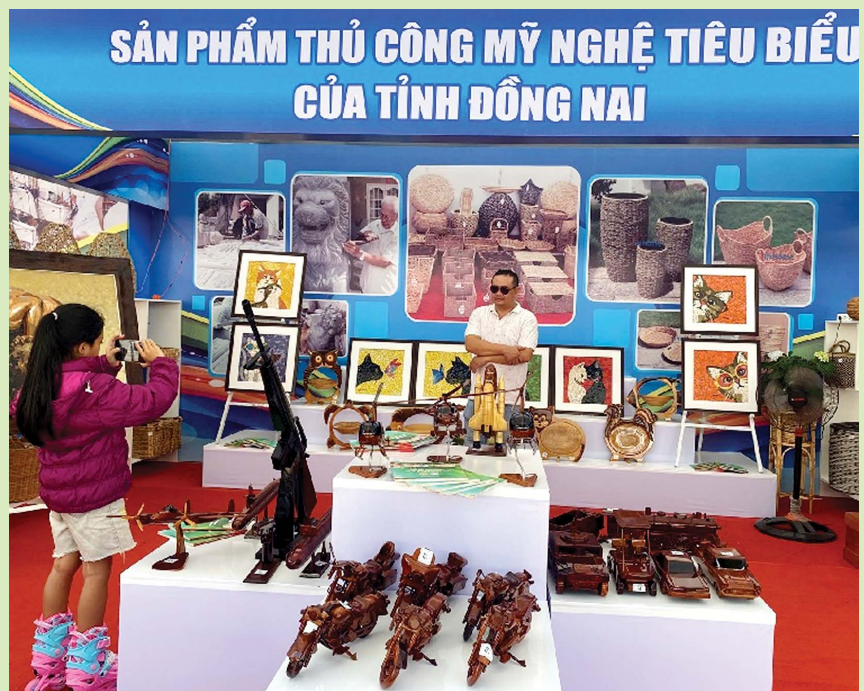
Sản phẩm gỗ của CS Thành Nhân được trưng bày tại Hội chợ Triển lãm Festival gốm.

léo và tâm huyết đặt vào từng sản phẩm. Từ nguyên liệu thô sơ ban đầu là những khúc, mảnh gỗ thừa ấy vậy mà qua bàn tay của Anh đã có sắt, cưa, bào, chỉnh sửa để có thể tạo nên hình thù của một chiếc xe hơi tinh tế, hay