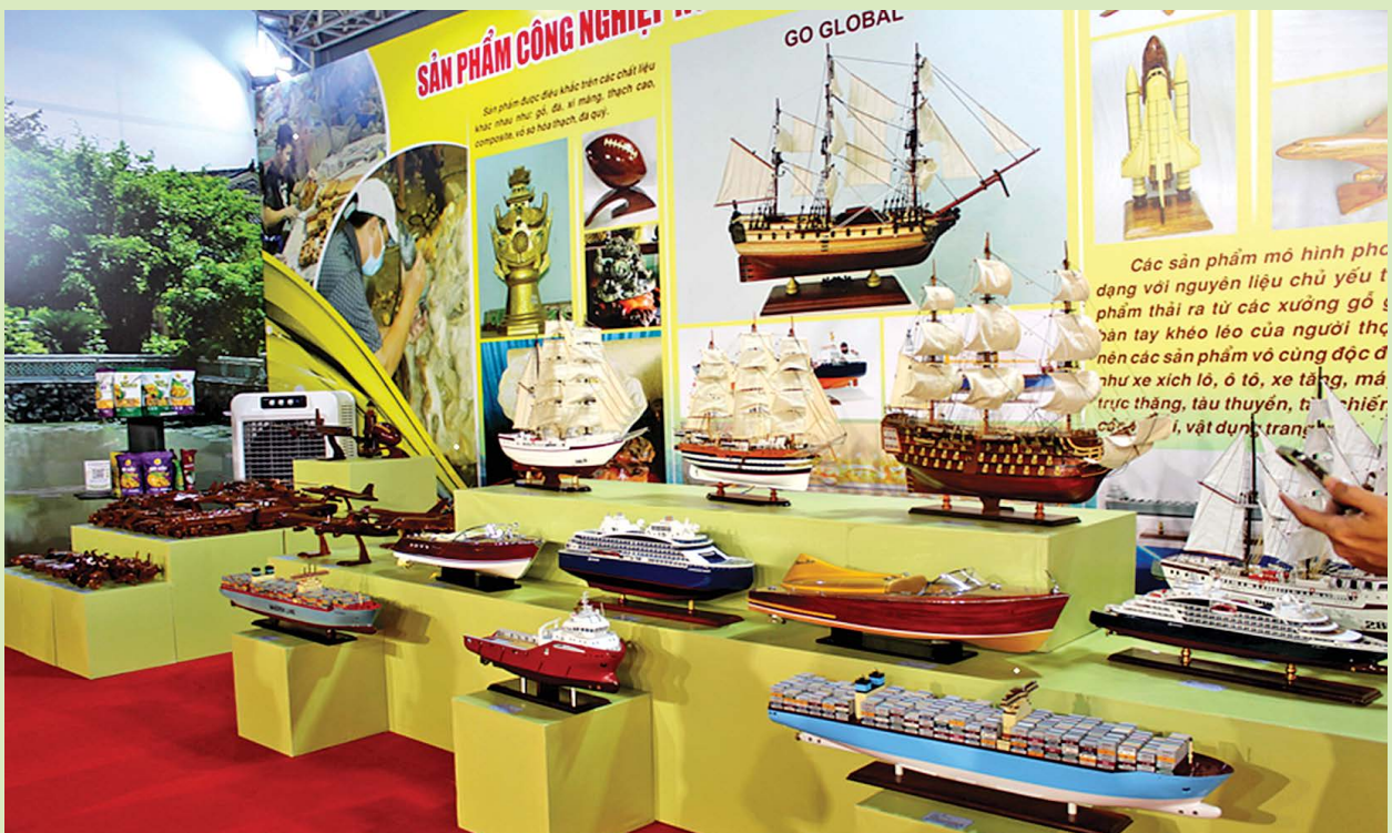
Sản phẩm gỗ mỹ nghệ của CS Nguyễn Thành Nhân được trưng bày tại gian hàng thủ công mỹ nghệ của ngành Công Thương tại lễ công bố tỉnh Đồng Nai thành lập thành phố.

sản phẩm độc đáo, tinh tế và thẩm mỹ cao và có giá trị sưu tầm rất lớn.